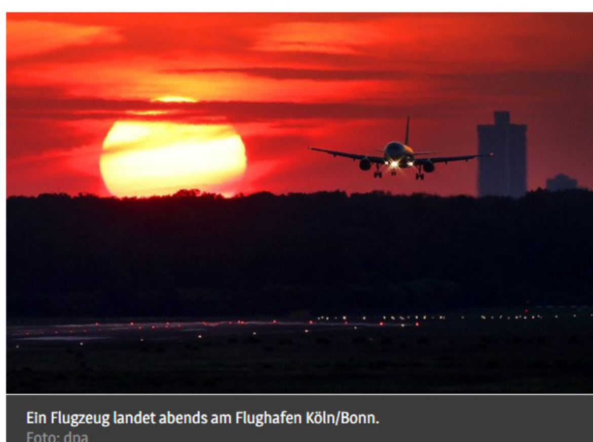
Ein Flugzeug landet abends am Flughafen Köln/Bonn.

Profitieren werden insbesondere diejenigen, die es in diesem Winter in die weite Welt zieht. Mit Windhoek und Kapstadt (ab 5. November) - jeweils einmal wöchentlich - nimmt die Eurowings auf ihrer Langstrecke gleich zwei neue Ziele im südlichen Afrika auf. Köln/Bonn bietet seinen Reisenden die einzigen Direktverbindungen aus Nordrhein-Westfalen in die beiden Metropolen an.