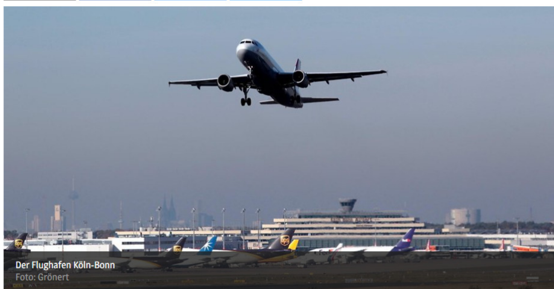
Der Flughafen Köln-Bonn