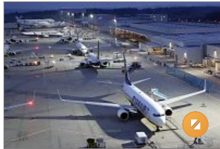
Flugzeuge der Ryanair auf dem Vorfeld des Flughafens Hahn

Der Flughafen Frankfurt-Hahn hat im vergangenen Jahr voraussichtlich 10,8 Millionen Euro an Verlusten geschrieben. Das sagte der rheinland-pfälzische Wirtschaftsminister Hendrik Hering (SPD) am Donnerstag in der Fragestunde des Mainzer Landtags. Der Minister betonte aber auch, dass es damit gelungen sei, die im Jahr 2009 noch auf rund 23 Millionen Euro prognostizierten Verluste deutlich geringer zu halten.